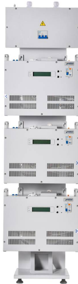
Мал.2. Розміщення стабілізаторів на стійці.

2. Розмістіть стабілізатори напруги на рамі, як показано на мал.2.