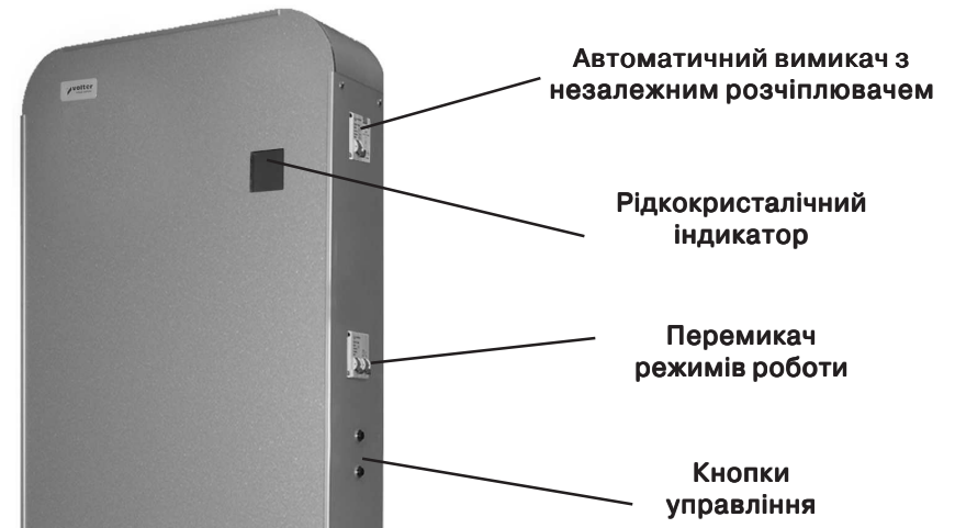
Мал. 1в. Стабілізатор напруги Smart-18, Smart-22, Smart-27.