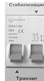
Мал. 5 Відключені обидва режими.

При несправності стабілізатора необхідно звертатися в сервісний центр, так як стабілізатор не розрахований на самостійний ремонт користувачем.