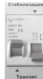
Мал. 6 Режим «Транзит».