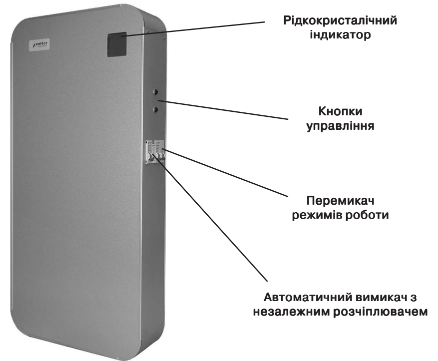
Мал. 1б. Стабілізатор напруги Smart-9, Smart-11, Smart-14.