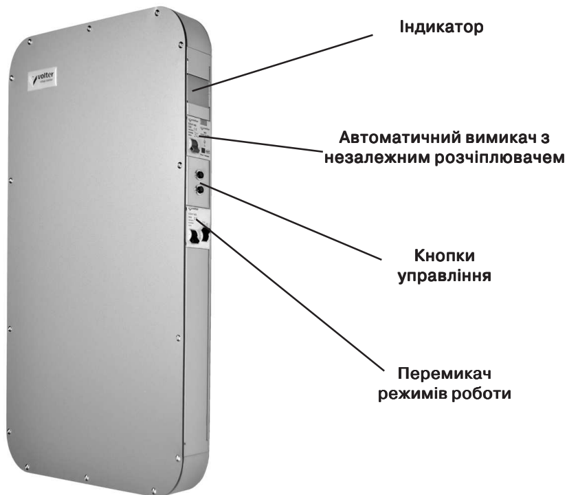
Мал. 1а. Стабілізатор напруги Smart-4, Smart-5, Smart-7.

Рідкокристалічний індикатор показує рівень вхідної і вихідної напруги і навантаження* у відсотках (*крім моделей Smart-4, Smart-5, Smart-7). На бічній панелі стабілізатора розташовані Автоматичний вимикач з незалежним розчіплювачем, перемикач режимів роботи "Стабілізація-Транзит" і кнопки управління.