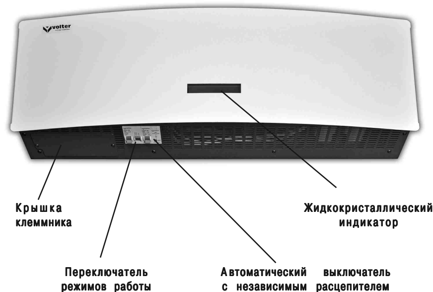
Рис. 1. Стабилизатор напряжения

На передней панели стабилизатора расположен жидкокристаллический индикатор, показывающий уровень входного и выходного напряжения, состояние электронных ключей и ток нагрузки в процентах. На нижней панели расположены автоматический выключатель с независимым расцепителем, переключатель режимов работы «Стабилизация-Транзит» и крышка клеммника. Там же расположен заземляющий контакт.